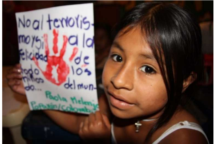
Weltweit: Rote Hand Aktion in einem kolumbianischen Projekt von terre des hommes.

Wir können Euch unterstützen, wenn wir von Eurer Aktionsidee wissen. Kurz vor dem 12. Februar veröffentlicht terre des hommes eine bundesweite Pressemeldung. Oft fragen dann Lokalmedien bei uns an und erkundigen sich nach Aktionen in ihrem Verbreitungsgebiet. Wir geben dann gern Eure Adresse als Ansprechpartner weiter. Darüber hinaus nutzen viele Organisationen die von uns eingerichtete Website www.redhandday.org . Ladet dort unbedingt ein Foto Eurer Aktion und die Zahl der gesammelten Handabdrücke hoch - denn nur dann werden sie weltweit mitgezählt!