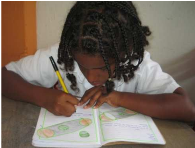
Bildungsarbeit im Benposta-Projekt

Der Friedensvertrag zwischen der FARC-Guerilla und der kolumbianischen Regierung ist ein Fortschritt. Unsere Partnerorganisationen Coalico und Conpaz waren direkt in die Verhandlungen einbezogen und haben dafür gesorgt, dass das Thema der Kindersoldaten bei der FARC nicht unter den Tisch fiel und dass diese jetzt in einem speziellen Programm Unterstützung bekommen. Die FARC wurde entwaffnet, doch die anderen Konfliktparteien kämpfen weiter. Bei der ELN und der EPL-Guerilla und den rechten Paramilitärs und kriminellen Banden gibt es weiter viele Kindersoldaten, viele Mädchen und Jungen sind in Gefahr, von den bewaffneten Gruppen in den Konflikt hineingezogen zu werden. Unsere Partnerorganisationen