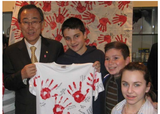
UNO-Generalsekretär Ban Ki Moon unterstützt den Red Hand Day.

Wichtig: Fotokamera für das Aktionsfoto (siehe auch Seite 6: Zeigt der Welt Eure Aktion!) Stellt hier auf der Webseite ein Foto eurer Aktion ins Netz.